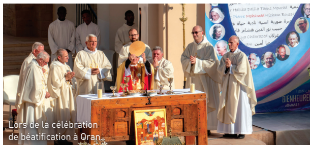
Lors de la célébration de béatification à Oran